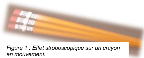
Figure 1 : Effet stroboscopique sur un crayon en mouvement.

Papillotement : la stabilisation trop limitée est un défaut qui touche beaucoup de luminaires LED ; ce qui a pour effet que l'onde sinusoïdale de la tension de réseau est visible dans la lumière produite. On parle alors de papillotement. Un autre phénomène est l'effet stroboscopique qui se produit à une fréquence bien plus élevée et qui n'est pas directement visible. En raison de ces variations, nous percevons les mouvements de façon saccadée, souvent sans en être vraiment conscients. Cela peut entraîner des problèmes physiques, comme des maux de tête. Il est cependant très simple de constater soi-même l'effet stroboscopique en utilisant un bâtonnet et en décrivant des allers-retours rapides.